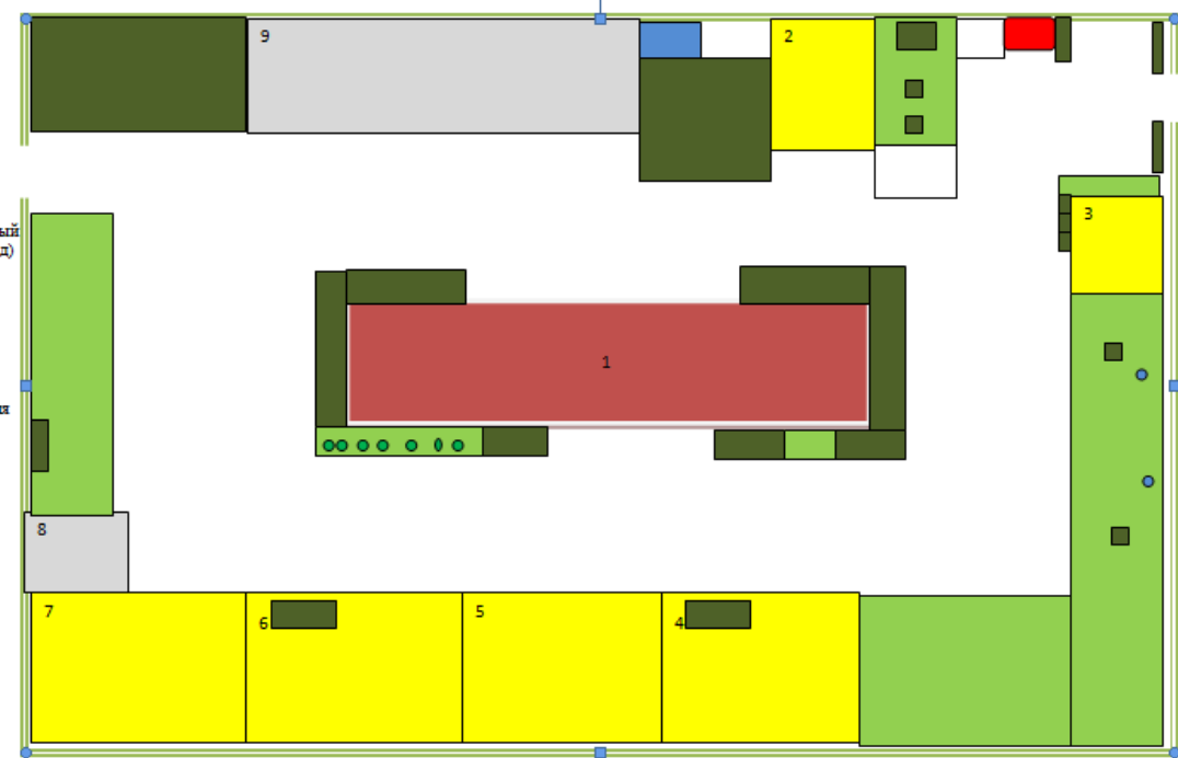
План – схема озеленения территории МБДОУ «ДС № 275 г. Челябинска» структурного подразделения